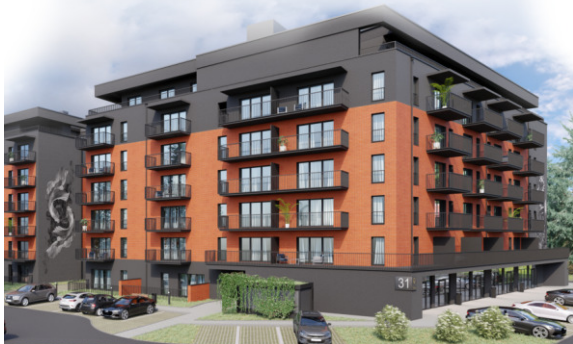
RZUT, SKALA 1:100

ŚCIANKI MOŻLIWE DO WYBURZENIA PRZED WYLEWKAMI