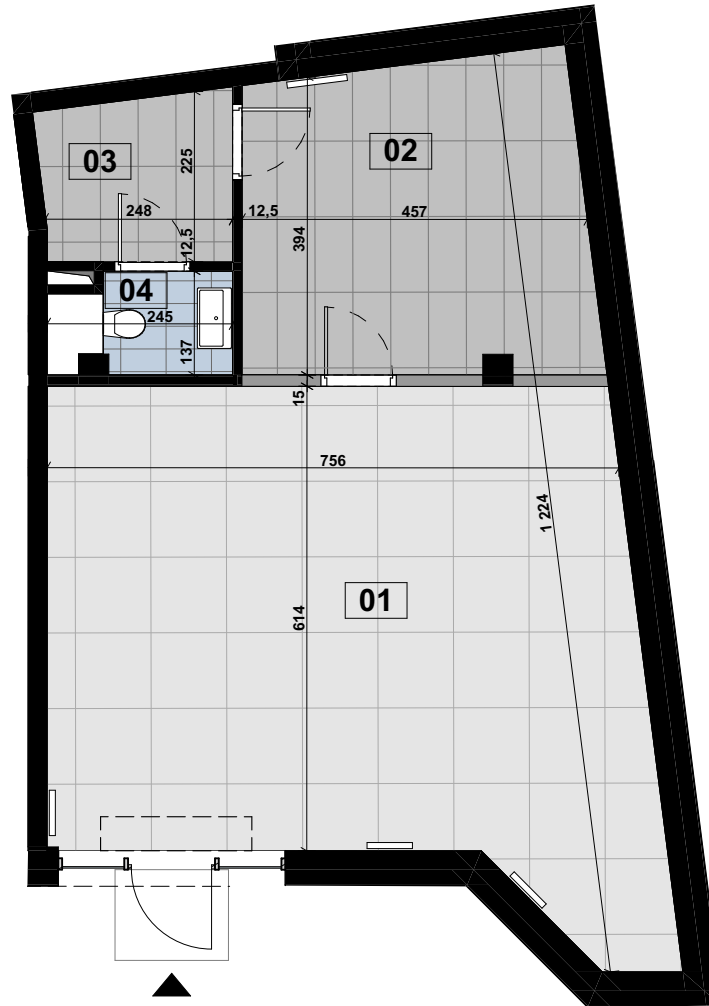
RZUT, SKALA 1:100

ŚCIANKI MOŻLIWE DO WYBURZENIA PRZED WYLEWKAMI